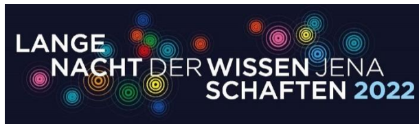
Abb. 3: Bei der »Langen Nacht der Wissenschaften Jena« können Gäste am Fraunhofer IOF die Geheimnisse der Quantenkommunikation live entdecken.

FRAUNHOFER-INSTITUT FÜR ANGEWANDTE OPTIK UND FEINMECHANIK IOF