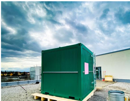
Abb. 1: Im Bauch dieses grünen Containers auf dem Dach der Jenaer Stadtwerke verbirgt sich ein spezielles Teleskop zur Quantenkommunikation.