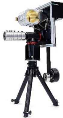
Abb. 4: Und so sieht das Teleskop aus. Dieses System verbindet das große Know-How im Design und der Fertigung von Metalloptiken am Fraunhofer IOF mit der Spitzenforschung im Rahmen der Quantentechnologien.